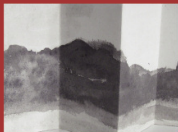
À la rencontre du matin Jeudi 3 juin