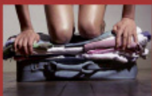
Mais on part où ? Samedi 12 juin