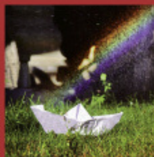
Soirée pyjama "Y'a du monde dans mon jardin !" Mardi 8 juin et 15 juin