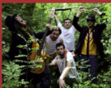
Inconnu Du Bataillon Samedi 19 juin