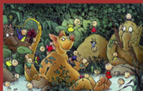
A la découverte de l'univers de Claude Ponti Jusqu'au 26 juin